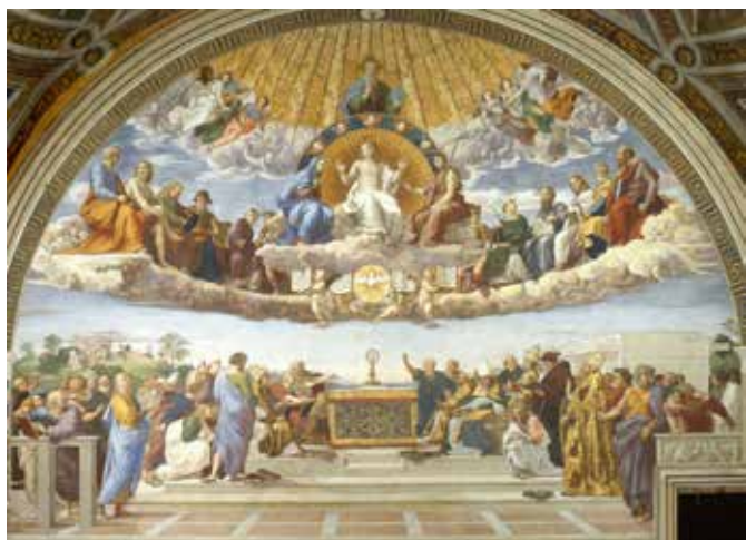
Raffaello SANZIO, Disputa del Sacramento , affresco, 1509, Stanza della Segnatura, Stanze Vaticane.

Tornando alle Stanze di Raffaello, nella Stanza della Segnatura c'è la Disputa sul sacramento: al centro l'ostensione che regge l'Eucaristia, in alto tutta la Trinità convocata, con l'adorazione e le schiere degli angeli; in basso i teologi e i dottori della Chiesa, tra i quali Raffaello inserisce Dante e Savonarola: la vita della Chiesa e la cultura, entrambe protese verso l'Eucaristia. Occorre ritrovare queste radici, per evitare che le celebrazioni siano soltanto qualcosa di folcloristico. Il Corpus Domini c'è già in ogni domenica, e in modo particolare nel Giovedì Santo. Ricordare le tre componenti – liturgia, arte e teologia – permette di concepire la festa del Corpus Domini con la consapevolezza di celebrare la presenza di Cristo nella storia.