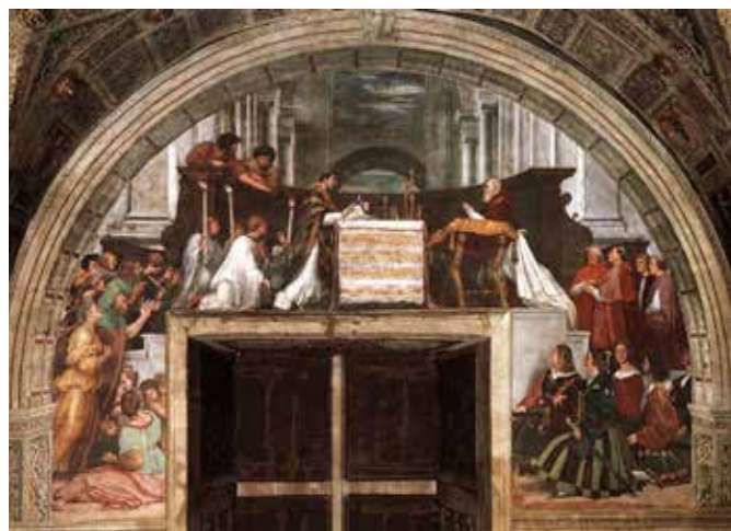
Raffaello SANZIO, la Messa di Bolsena , 1512-14, Musei Vaticani, Palazzi Apostolici, Stanze di Raffaello, Stanza di Eliodoro, Musei Vaticani.